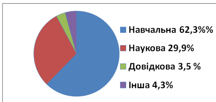
Рис.1 Склад ЕБ за видами літератури

Опікується формуванням БД «Електронна бібліотека університету» сектор електронної бібліотеки. На початок 2019 року ця БД нараховує близько 10 тис. документів. Це навчальна, методична, наукова, художня література, нормативні документи а також періодичні фахові видання. Склад ЕБ за видами літератури представлено на рис.1.