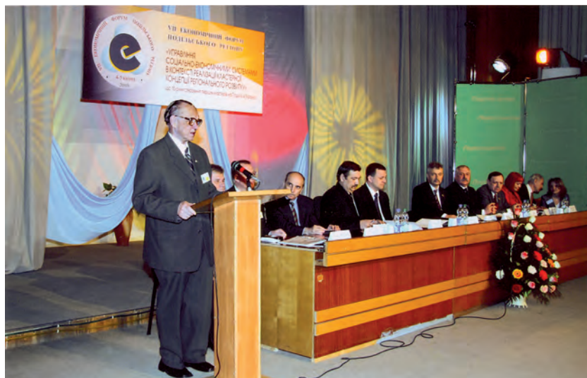
Під час доповіді на VII Економічному форумі Подільського регіону. 2008 р.