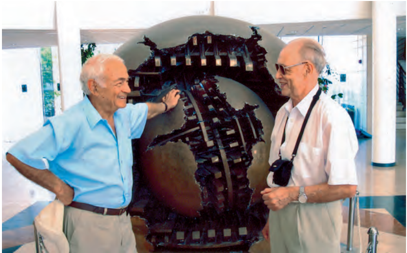
З професором В. Ройзманом в університеті Тель-Авіву. 2009 р.