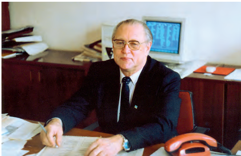
Робота над планами університету. 1998 р.