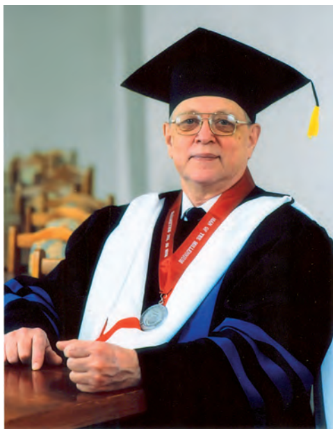
“Людина тисячоліття”. 2002 р.