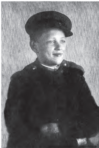
Рядовий топографічної служби 65-го моторизованого топогра- фічного загону. Угорщина, 1945 р.