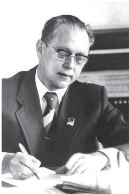
Ректор. 1981 р.