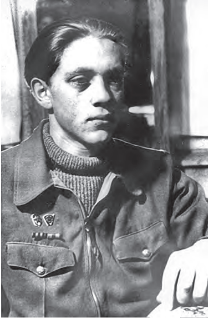
Студент Львівського політехнічного інституту. 1953 р.