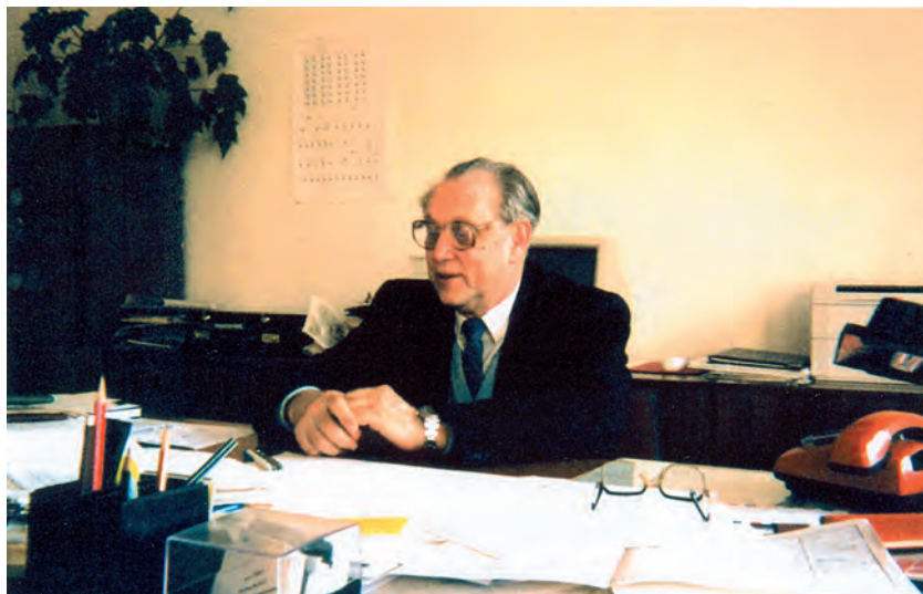
На робочому місці. 1985 р.