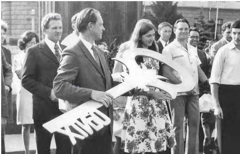
Вручення “ключа до знань” на посвяченні у студенти ХТІПО. 1976 р.