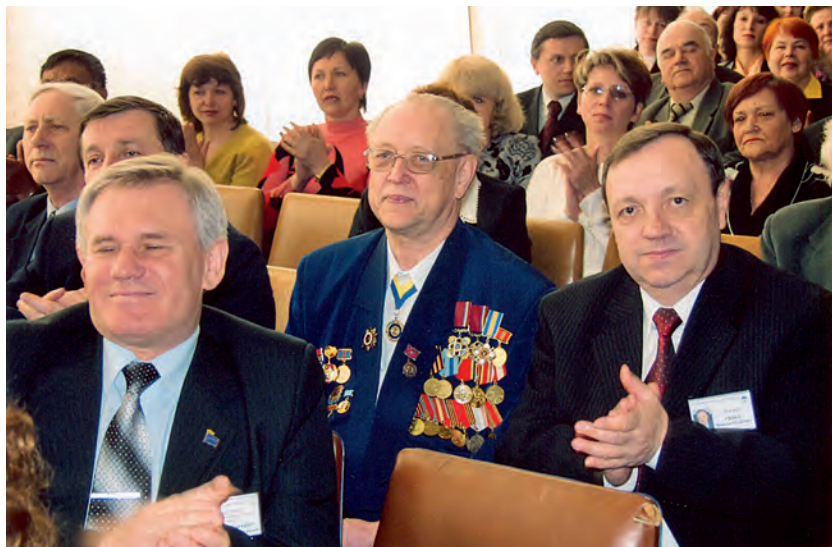
У гуці людей на урочистих зборах 8 травня 2006 р.