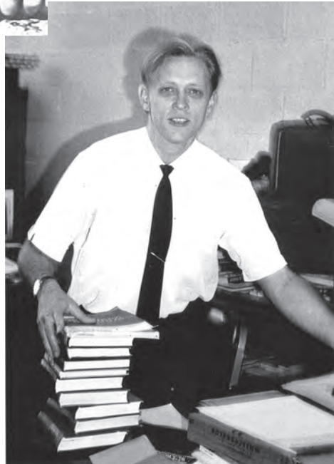
На стажуванні в Університеті Мічигану (США). 1965 р.