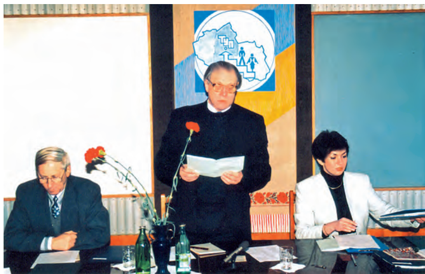
Під час засідання Вченої ради. 1995 р.