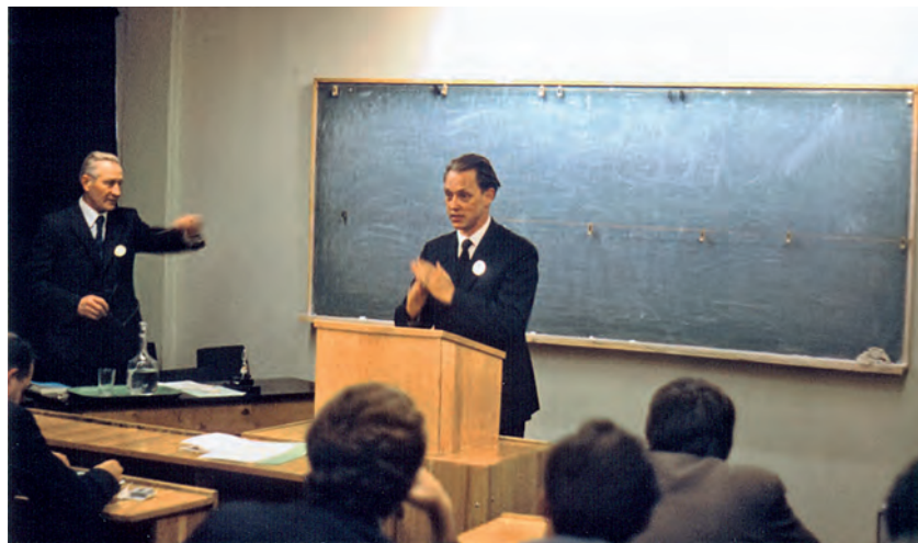
Під час доповіді на всесоюзній конференції “Вібраційна техніка в машинобудуванні і приладобудуванні”. Львів, 1973 р.