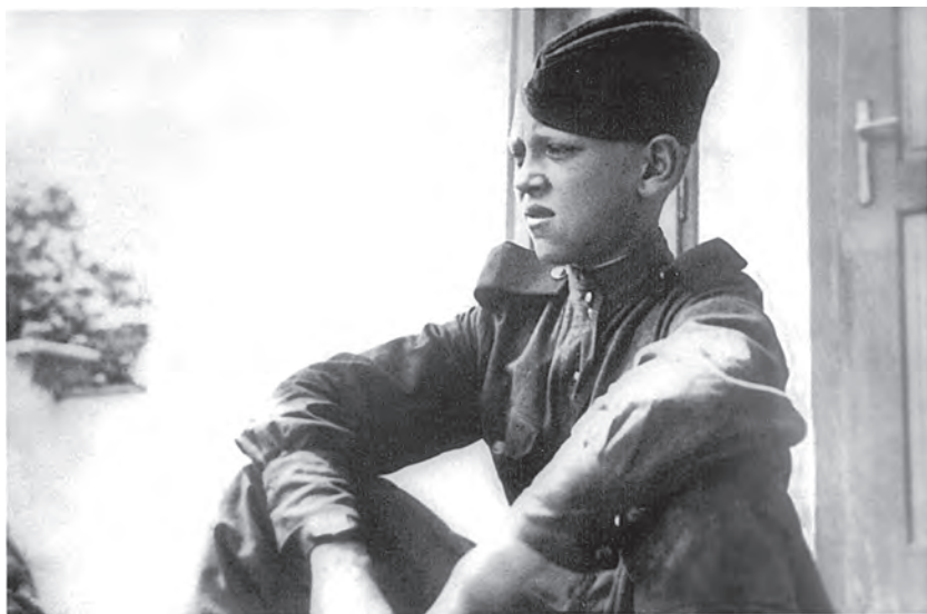
У передмісті Відня (Австрія). Квітень 1945 р.