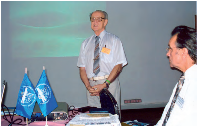
Під час доповіді на конференції в Хургаді. 2010 р.